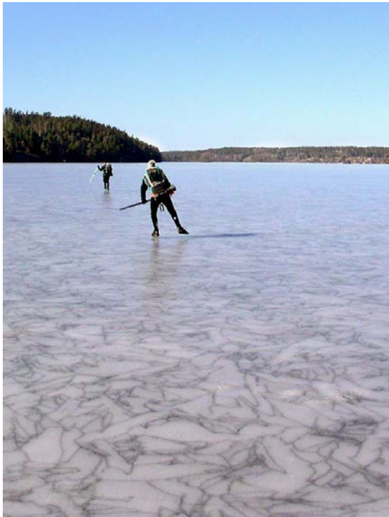
Krackelerad kärnis med mycket stora iskristaller. Trots att det var mycket sent på säsongen, höll sig isen hård och stark. De större kristallerna har blivit ljusgrå, vilket skyddar isen mot solen. Klämningen, 2 april 2004.

Hur isen påverkas av solstrålningen beror till stor del på vilken typ av kristaller som isen består av. Krackeleringen uppträder först i is med stora iskristaller. Kristaller större än en decimeter får efterhand en grå färg som delvis skyddar isen mot solen. Sådan is kan nästan förväxlas med stöpis. Stora iskristaller har ofta en oregelbunden form. Isen kan därför hålla ihop väl, likt ett pussel, även om kristallerna har separerat från varandra. Mindre kristaller är mer genomskinliga och försämras mer av solen.