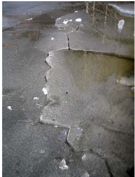
Olika is på samma sjö. Den smalstaviga isen till vänster, faller isär av sig själv. Den med stora kristaller till höger, håller ihop lite bättre. Isens var cirka 20 centimeter på båda ställena. Hållsta Långsjö, Gnesta, 8 april, 2004.