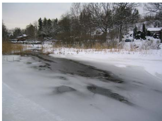
Strömfrätning vid åmynning. Notera de mörka fräthålen. Magelungen, 27 november, 2004.

Normalt är vattnet närmast isen nollgradigt. Stillastående vatten är en dålig värmeledare, så även om djupare vatten håller flera plusgrader, förmår inte den värmen att tränga upp och påverka isen när vattnet står stilla. Finns det däremot strömmar i vattnet, kan varmare djupvatten föras upp och fräta på isens undersida. Isen tunnas ut, men dess kvalitet påverkas inte nämnvärt. Ofta sker uttunnning ojämnt till följd av virvlar i strömmarna – det uppstår fräthål. I ljus is kan fräthål synas som mörka fläckar i isen.