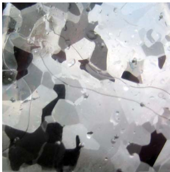
Isens kristallmönster framträder om man håller en tunn isskiva mellan två korslagda polariserande filter. Denna is är 7 cm tjock och har smala stavformade kristaller. Till vänster isen från sidan (naturlig storlek); till höger isens undersida (något förstord). Is från Yngern, Sörmland, 6 januari 2005.