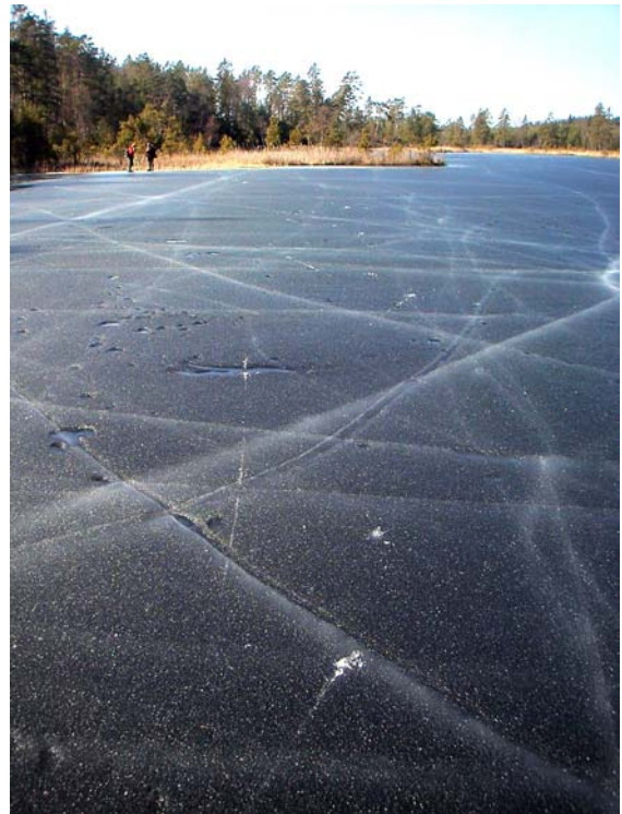
Smalstavig kärnis i starkt förfall (pipis). Isen var 2 – 3 dm tjock, men bara 5 cm i botten höll god styrka. Den mörka färgen är en tydlig varning. Längs de ljusa sprickorna hade isen en något bättre styrka. Fräkensjön, Gnesta, 26 mars 2003.

Mest farlig är is med smala stavformade iskristaller. Sådan is har en mörk färg och absorberar därför mer solstrålning. Ofta syns krackeleringen senare och svagare i denna typ av is, men när sönderfallet väl har börjat går det snabbt. De smala iskristallerna håller dåligt ihop, men så länge isen är hel kan stavarna stötta varandra. Men plurrar man på sådan is finns ingen fast kant att ta sig upp på – isstaverna faller ihop likt ett korthus. Detta är den fruktade pipiga värisen!