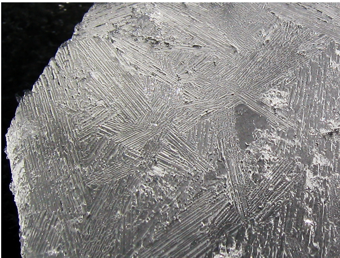
Figur 1. Undersidan av en bit saltis med tydliga lameller. Avståndet mellan lamellerna är knappt en millimeter, mindre än iskristallernas storlek. Kristallgränserna kan urskiljas där lamellmönstret ändrar riktning. (Nysis på Mälbyfjärden, Stockholms södra skärgård, februari 2004)

En annan speciell egenskap hos saltis är att undersidan inte är slät och kompakt, som hos sötis, utan består av friliggande lameller (figur 1). Tillsammans gör dessa egenskaper att bärigheten hos saltis aldrig går att bedöma enbart utifrån isens tjocklek. Dessutom är saltisen besvärligare att bedöma utifrån ljud och utseende, samt även med piken.